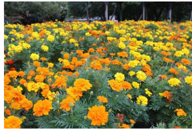
マリーゴールド、サルビア、 ペチュニアなど