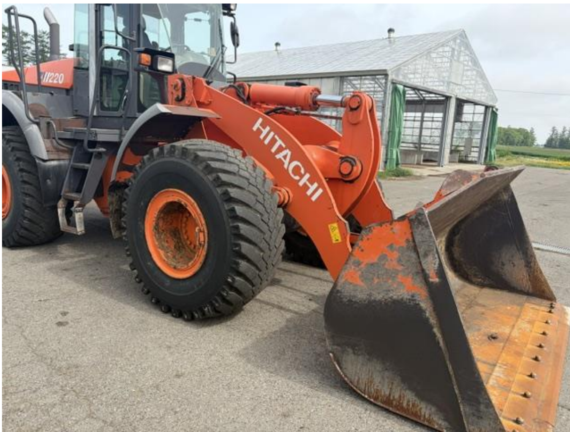
日立ホイールローダー ZW220 令和8年5月27日撮影