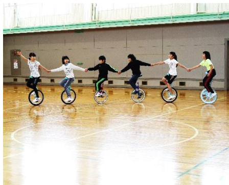
ユニサイクルチャレンジ(一輪車による演舞)