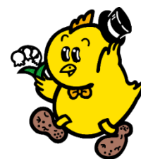
中札内村マスコットキャラクター「ピータン」