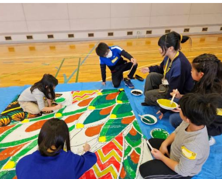
武蔵野美術大学との交流